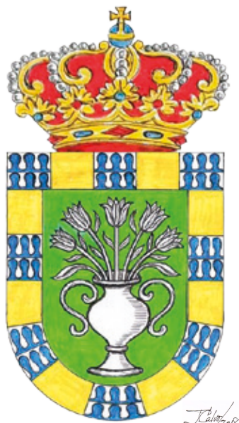
Fig. 2 Escudo de Siero